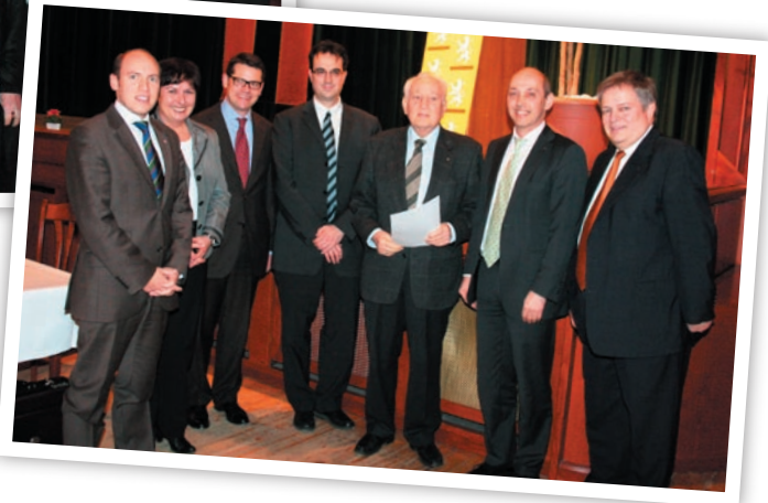
Bild rechts: Für 50 Jahre Mitgliedschaft in der CDU wurde der frühere hessische Innenminister und langjährige Landtagsabgeordnete Gottfried Milde sen. geehrt.