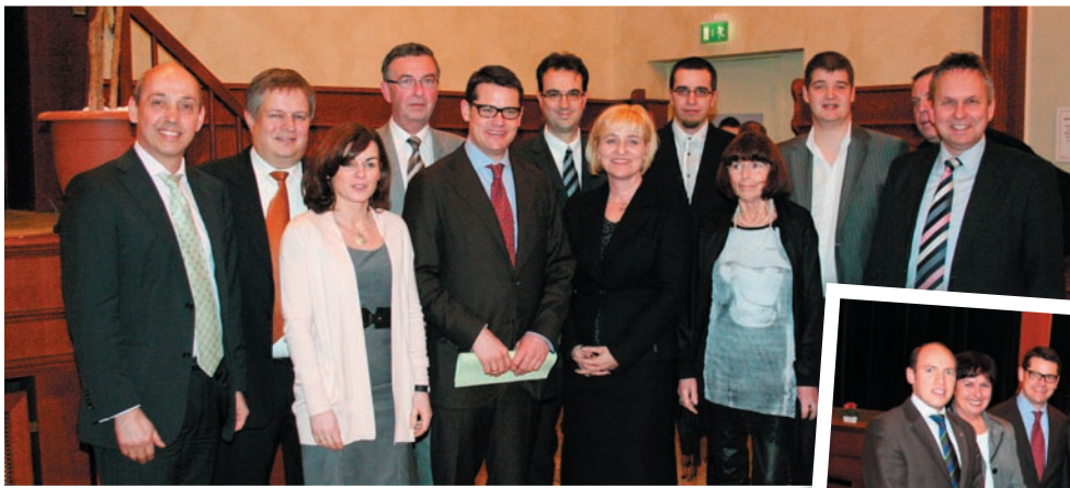
Bild oben: Mitglieder der CDU Griesheim mit dem neuen Innenminister Boris Rhein im Bürgerhaus „Zöllerhannes“